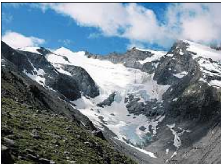
Bald zweiter Nationalpark? Der Bund unterstützt den Parc Adula rund um das Rheinwaldhorn (3402 m ü. M.).

Das Projekt für den Parc Adula der Kantone Graubünden und Tessin ist der erste Kandidat für einen weiteren Nationalpark in der Schweiz. Das Bafu gewährt den beiden Kantonen für die Schaffung des Parks rund um das Rheinwaldhorn und den Adula Finanzhilfe von voraussichtlich 686 000 Franken. Das Geld ist für die Jahre