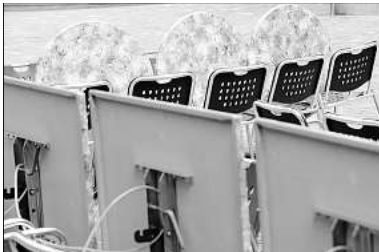
Nichts als Regen: bald bessere Aussichten – für die Besitzer von Gartenrestaurants?

Weitere Informationen unter www.engadin.stmoritz.ch .