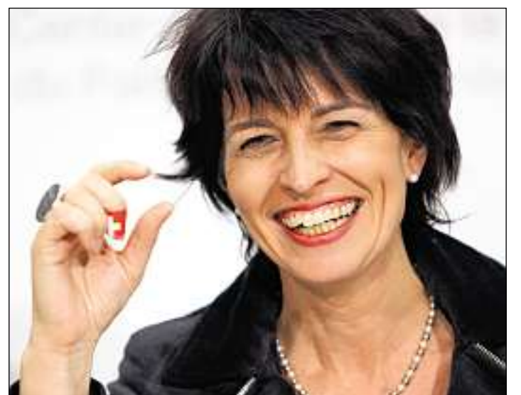
Doris Leuthard vul curreger la politica dal cussegl federal.